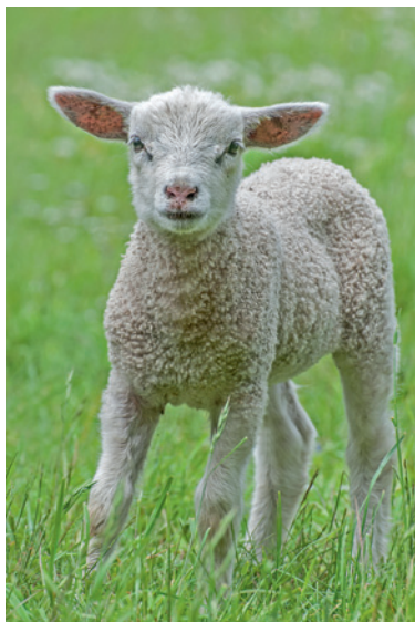
Lamm im Frühling, siehe Workshop: „Zartheit betonen“.

fangen verstärkt an zu singen, Zugvögel kehren zurück, wärmende Sonnenstrahlen verwöhnen die Natur, Blumen dringen durch die Erde an die Oberfläche, erste Blüten sind zu finden und im Verlauf des Frühlings gibt es immer mehr Jungtiere. Ob junge Schwäne, kleine Entchen oder Lämmer – alle üben einen geradezu magischen Reiz auf viele Naturfotografen aus. Das Frühjahr ist die Jahreszeit des neuen Entstehens und der Reproduktion.