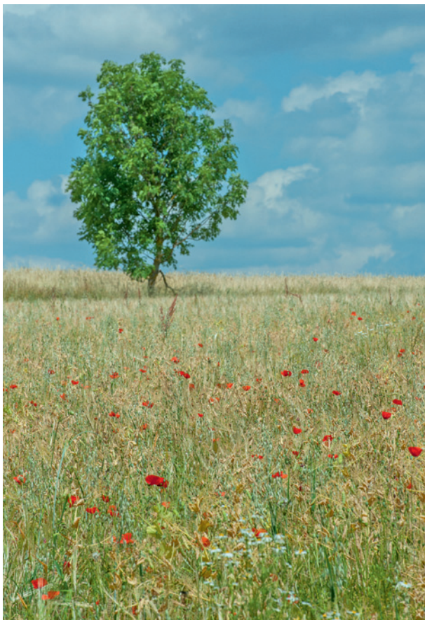
Getreidefeld mit Mohn und Baum, siehe Workshop: „Sommerlandschaft“.