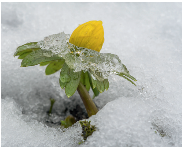
Winterling im Schnee, siehe Workshop: „Winterling mit Haube“.

Sie Ihre Fantasie spielen. Hinter manchem Eisgebilde könnte auf dem zweiten Blick ein Gesicht oder etwas Ähnliches verborgen sein (siehe Workshop „Fantasiefigur aus Eis“). Lassen Sie sich also im Winter nicht vom Wetter davon abhalten rauszugehen und zu fotografieren.